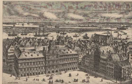
i. Der Markt in Antwerpen, im Hintergrund der Hafen.