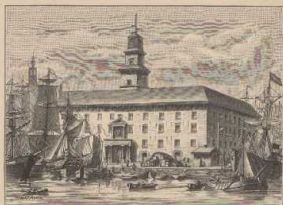
b. Das Hansas in Antwerpen.