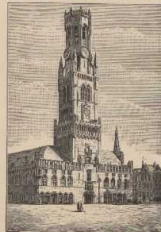
g. Belfry in Brügge.