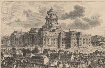
h. Der Justizpalast in Brabant.