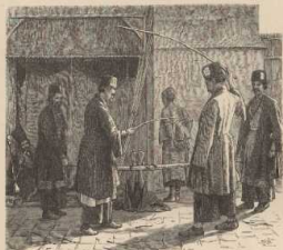
g. Die Basenade.