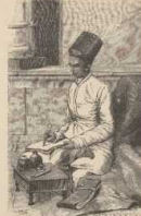
e. Perserherrscher (aus Bombay).