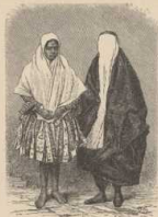
b. Perserinnen in Haus- und Straßenumzug.