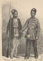
d. Persische Schlichter.