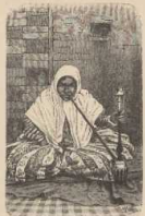
a. Perser in Wasserpfeife.