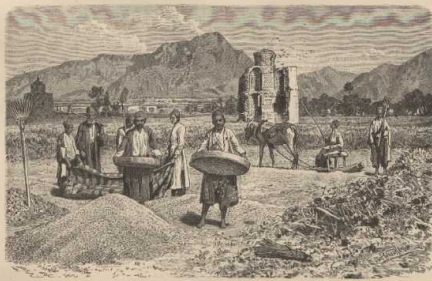
m. Pers. Fellearbeiter beim Reinigen des Gewolltes. (Im Mittellande: Tschakottens.)