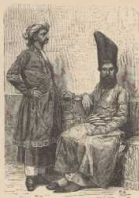
c. Persische Großkaufleute.