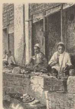
h. Pers. Schuade bei der Arbeit.