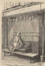
i. Pers. Teppichweberin (nach Bengsch).