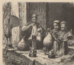
k. Persische Bronzschleifer.