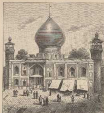
c. Grate eines Heiligtums in Schina.