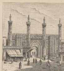
d. Thor in Teheran (nach Brugsch).