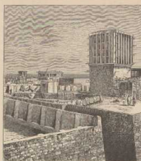
b. Winter in Bascheh.