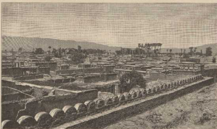
g. Ansicht von Schina, von der Burg (Aeg) gesehen.