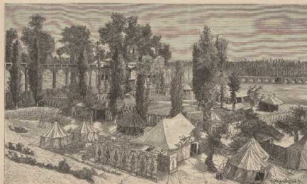
h. Zeltlager eines pers. Fürstenthums. (In Illustration Aguchki über den Fluss Zaidheruk.)