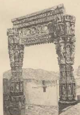
g. Thorbogen in Rewa in Centralindien. (Nach Casselmann, Arch. Survey.)