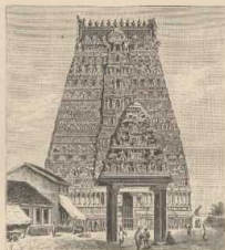
f. Tempel in Kanakolam in Pondicherry. (Nach Tuxen de munda.)