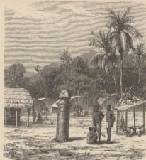
a. Dorf der Santal (in Nordbengalen). (Nach Schlegelweck, Indien.)