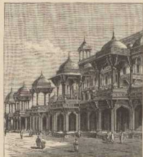
e. Akbar's Mausoleum in Agra. (Nach Schlegelweck, Indien.)