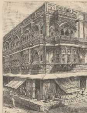
c. Kaufhaus der Sech in Achmet. (Nach Schlegelweck, Indien.)