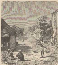
b. Strasse in Techenpurgar in Bengalen. (Nach Tuxen de munda.)