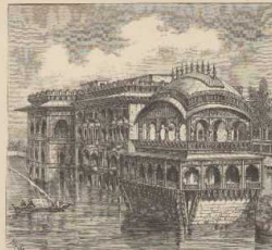
d. Palast (Gopal Bhawan) bei Agra. (Nach Schlegelweck, Indien.)