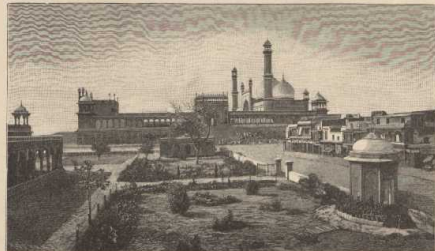
i. Dehli-Residenz in Dehli. (Nach Photographie.)