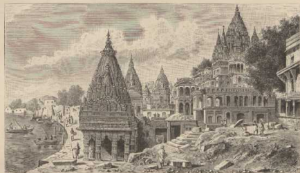
k. Ansicht von Benares. (Nach Photographie.)