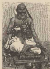
h. Indische Siva-Schiva.