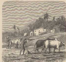
a. Ackerbau in Südindien.