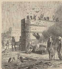
g. Thierverheerung in Kalkutta.