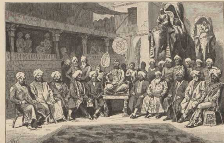
d. Durbar eines indischen Fürsten in Nordwestindien.