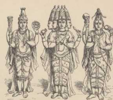
f. Die Trimurti.