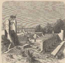
b. Indigeherstellung in Bengalen.