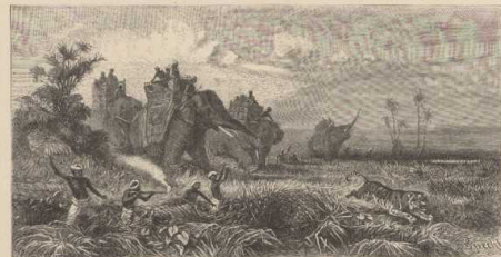
c. Thierjagd mit Khasianen in Nord-Bengalen.