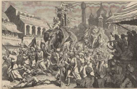
i. Großer Festzug der Mahaschnher in Bhopal, Centralindien.