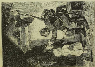
Der Landweyermann in Friedensland.