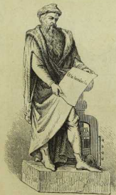
Gutenberg. Denkmal in Straßburg im Gifhof. Von David d'Angers.