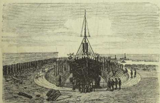
Schiff in Werft.

Nach: H. Werner, Das Buch von der norddeutschen Flotte. Bielefeld und Leipzig 1869.