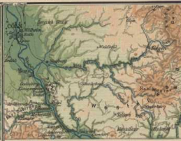
Der Rhein von Bingen bis Cöln.