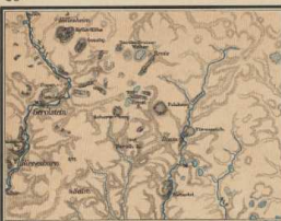
Die Vulkanreihe der Eifel.