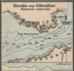
Die Schwelle v. Gibraltar. Länge u. Tiefe = 1:625.

Anbau und Seefischerei. W Wein Oliven Thunfische Sardinen u. Anchovise Orte mit bedeutender Seefischerei.