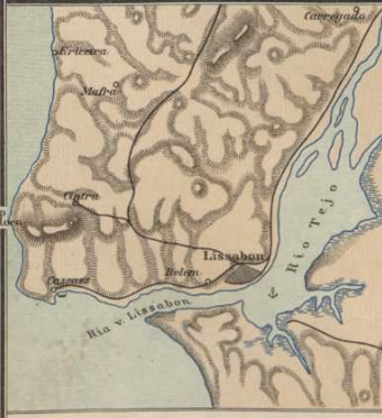
Lissabon. M. = 1 : 500 000 (1 cm = 5 km)