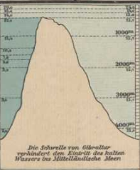
Senkrechte Wärmeverteilung im Mittelländ. Meer. Die Schwelle von Gibraltar verhindert den Einström des kalten Wassers ins Mitteländische Meer.