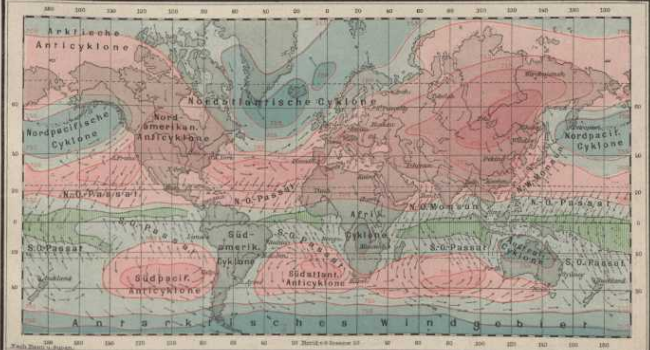
Luftdruck und Winde im Juli.

— über 100 mm. Barometerstand — unter 100 mm. Barometerstand — Isobar