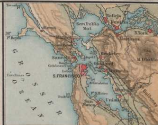
S. Francisco u. Umgegend.