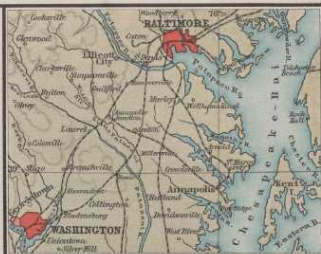
Baltimore u. Washington.