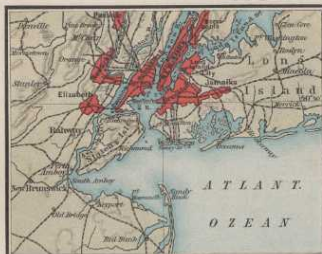
New York u. Umgegend.