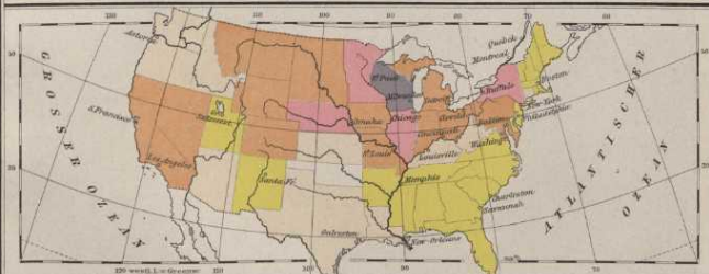
Verbreitung der Deutschen.