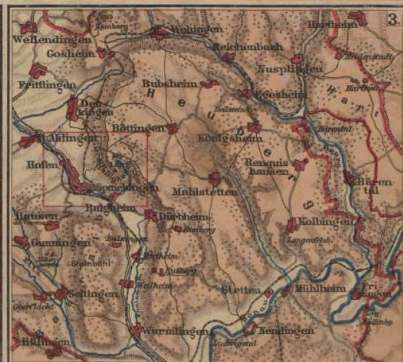
Geländedarstellung durch Schraffen, Höhenkurven und farbige Höhenstufen. Entstehung eines freistehenden Einzelberges durch rückschreitende Erosion Maßstab 1:25.000, Maßstab 1:100.000, Maßstab 1:200.000. W. A. F. 28.