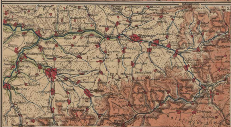
Nr. 1. Hoher Schwarzwald.