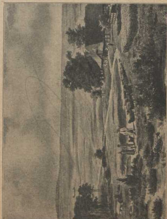
Marschlandschaft mit Deich und Watt. (Deutsche Nordseeküste) (Aus Seydlitz' Geographie, Ausgabe C., Breslau, Ferdinand Hirt.)