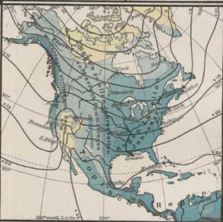
GEOLOGISCHER AUFBAU MASZTAB 1 : 100.000 000

Jährliche ■ unter 25 Zentimeter ■ 25 - 50 " " " " ■ 50 - 100 " " " "