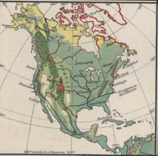
REGEN UND TEMPERATUR MASZTAB 1 : 100.000 000

■ Wälder und Winterweiden ■ Tundras ■ Arktische u. Hochgebirgsflora ■ Grasland u. Savannen (Tropen)