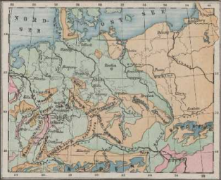
Karte der mittleren Jahrestemperatur in Deutschland.