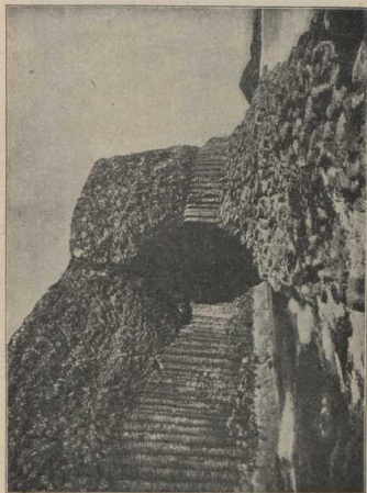
Empörung 52 m hoch.