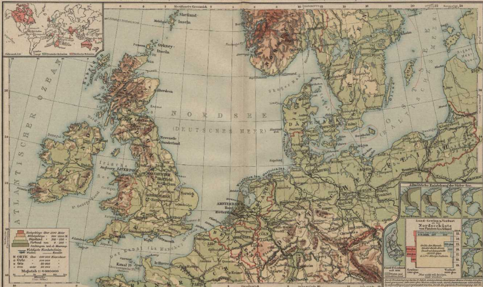
Veränderung des Liniens auf der Karte des Nordseegebietes.