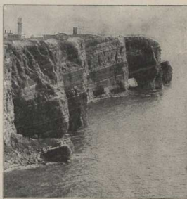
Nordspitze von Heligoland. (Atlas S. 6/7.)