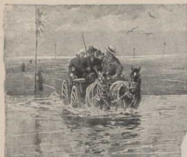
Postfahrt durch das Wattenmeer im Sommer. (Atlas S. 6/7.)