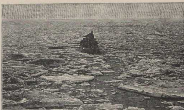
Postfahrt durch das Wattenmeer im Winter. (Atlas S. 6/7.)