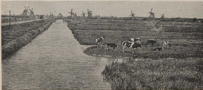
Holländische Marschenlandschaft. (Atlas S. 6/7.)