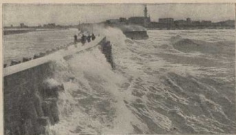
Brandung bei Warnemünde. (Atlas S. 6/7.)