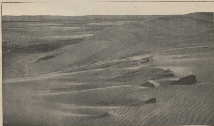
Große kurische Wanderdüne. (Atlas S. 6/7.)