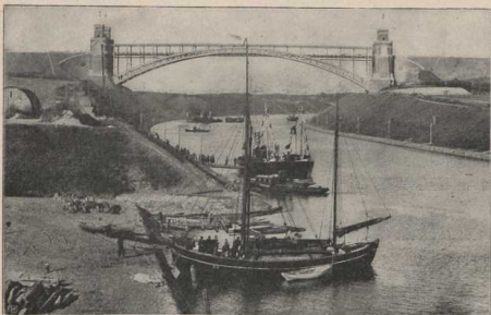
Hochbrücke bei Levensau. (Atlas S. 6/7.)