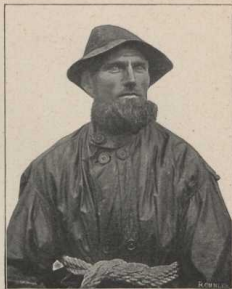
Fischer von Dievenow. (Atlas S. 6/7.)