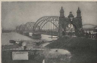
Die neue Brücke von Harburg nach Hamburg.