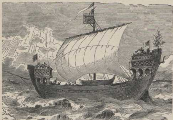
Hansisches Kriegsschiff des 13. Jahrhunderts.