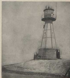
Leuchtturm bei Neufahrwasser. (Atlas S. 6/7.)