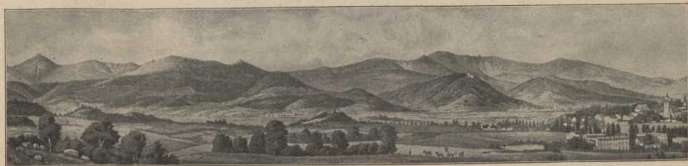
Panorama des Riesengebirges mit Warmbrunn. (Atlas S. 6/7.)