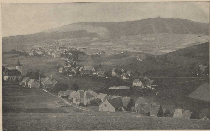
Wiesenthal am Fichtelberg im Erzgebirge. (Atlas S. 6/7.) Höchstgelegene Stadt Deutschlands. (914–924 m.)