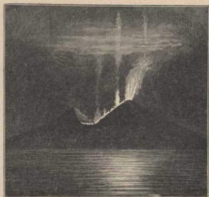
Vesuv-Ausbruch bei Nacht. (Atlas S. 21.)