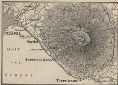
Der Vesuv. (Atlas S. 21.)