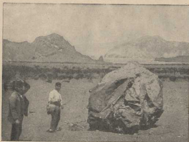
Vom Vulkane ausgeschleuderte Lavaklumpen. (Atlas S. 21.)