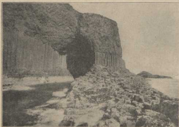
Fingalshöhle bei Staffa. (Atlas S. 24.)