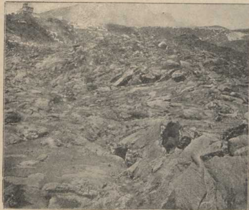
Lavafelder am Vesuv. (Atlas S. 21.)