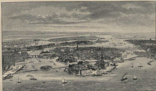
4. Stockholm (von Westen gesehen). Siehe Atlas S. 11. (Malar-See im Vordergrund.)