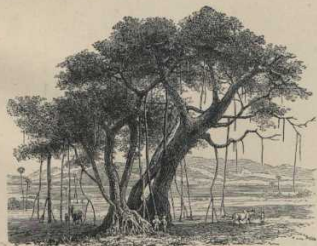
10. Banjane (Ostindien).

Sendet Luftwurzeln in die Erde, die neue Bäume ergenzen (siehe links). Verwandt damit ist der gemeine Feigenbaum (Cordofanien, Südennropa) mit den bekannten Früchten.