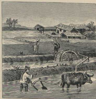
6. Zurichtung des Reisfeldes (China).

Sendet Luftwurzeln in die Erde, die neue Bäume ergenzen (siehe links). Verwandt damit ist der gemeine Feigenbaum (Cordofanien, Südennropa) mit den bekannten Früchten.