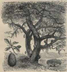
8. Gamblättriger Brotschraubbaum. (Rothbaum, Ostindien.)

Früchte 5–12 kg schwer, werden roh, gekocht oder in Palmöl gebraten genossen, dienen in manchen Gegenden (Siam) einen großen Teil des Jahres über als Nahrung. — Der gemeine Brotbaum ist auf den Südeezulein heimisch. „Drei Bäume sind im Lande, einen Menschen jähren und jähren zu ernähren.“