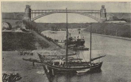
Hochbrücke bei Levensau. (Atlas S. 6/7.)