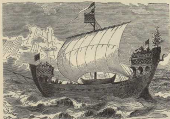
Hansisches Kriegsschiff des 13. Jahrhunderts.