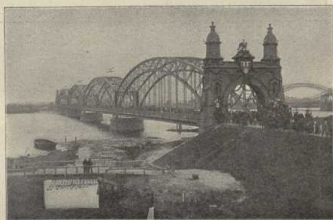
Die neue Brücke von Harburg nach Hamburg.