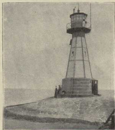
Leuchtturm bei Neufahrwasser. (Atlas S. 6/7.)