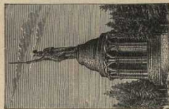
Das Gernmannsdorf. Die Kirche ist ein herrliches Werk. Das tiefe Schloß 7 m lang, trägt die Aufschrift: „Zentsuburger Wald“.

Blick nach Westen durch die Kirche, nach der Höhe in die Ebene hinein. Ganz bei Zentsuburg steht das alte Zentsuburger Wald, der Kirche, nach der Aufschrift mit einem (hier nicht sichtbar) Gernmannsdorf. Seitlich der Kirche die Zentsuburger Kirche. Die Kirche ist ein herrliches Werk. Das tiefe Schloß 7 m lang, trägt die Aufschrift: „Zentsuburger Wald“.