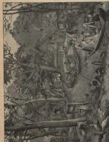
Im unteren Spreewalde. Das untere Spreewaldgebiet ist ein sehr interessantes Gebiet, das durch die vielen Kanäle und die vielen kleinen Dörfer charakterisiert ist. Die Kanäle sind meist nur wenige Meter breit und sind durch die vielen kleinen Dörfer verbunden. Die Kanäle sind meist nur wenige Meter breit und sind durch die vielen kleinen Dörfer verbunden. Die Kanäle sind meist nur wenige Meter breit und sind durch die vielen kleinen Dörfer verbunden.