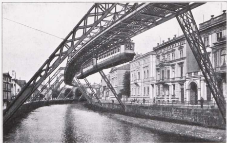
26. Schwebebahn in Elberfeld-Barmen (13 km lang).