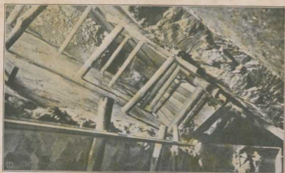
Abbau eines Kohlenstellers.