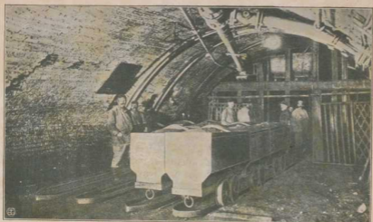
Unterm Anschlagspunkt eines Bremsberges bei steiler Lagerung.